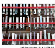
増福寺夢かけ風鈴

風鈴の短冊に願い事を 書いて奉納できます(有料)。 境内には常時3000個の 風鈴の音が響き渡ります。