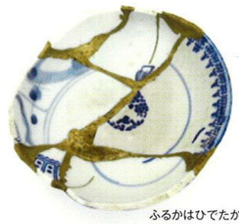
ふるかはひでたか