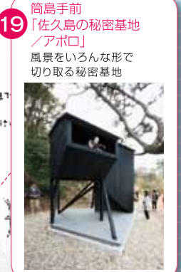
19 筒島手前 「佐久島の秘密基地 / アポロ」 風景をいろんな形で切り取る秘密基地