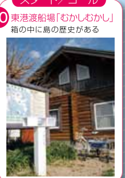
20 スタート/ゴール 東港渡船場「むかしむかし」 箱の中に島の歴史がある

★ 印の作品にはスタンプがありません。 ● 印の作品は佐久島弘法プロジェクトの常設作品です。 別紙「佐久島弘法巡り」でスタンプラリーができます。 □ は期間限定作品です。