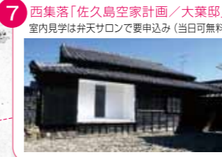
7 西集落「佐久島空家計画/大葉邸」 室内見学は弁天サロンで要申込み(当日可無料)