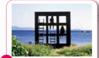
8 石垣海岸「おひるねハウス」 波音をききながらのんびりしてね