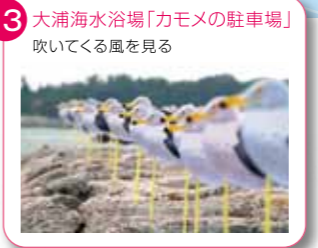
13 大浦海水浴場「カモメの駐車場」 吹いてくる風を見る