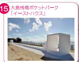
15 大島棧橋ポケットパーク 「イーストハウス」