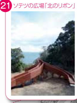
21 ソテツの広場「北のリボン」