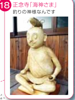
18 正念寺「海神さま」 釣りの神様なんです