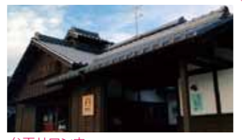
5 弁天サロン内 「西港歓迎太鼓」箱の中をのぞいてみよう