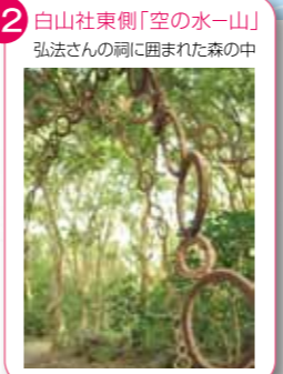
12 白山社東側「空の水一山」 弘法さんの祠に囲まれた森の中