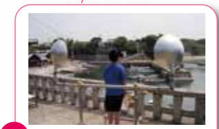
4 崇運寺「ガリバーの目」 石段を登った崇運寺の境内だよ