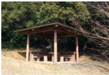
ひだまり庵となるあずまや

佐久島中央部を東西に貫く「ハイキングコース(別名ツバキロード)」に、今年2月完成した『北のリボン』に続いて松岡徹の『ひだまり庵』が登場します。会場は昭和50年代、ハイキングコースにつくられた3つの公園のひとつ「ひだまりの広場」。南に向けた広場は森の中にあってもぼっかりと明るいならかな芝生の斜面で、そこにある古い東屋が「ひだまり庵」と名付けられ、松岡徹の作品として生まれ変わります。今回の『ひだまり庵』はモザイクタイルを材料に、すでにある建造物上に絵を描くという方法でリノベーションを行い、今後は公園全体を数年かけて作品化していく予定です。会場のひだまりの広場は東渡船場から約2キロ。徒歩25分、自転車10分の距離です。ハイキングコースは舗装されていませんので、自転車の方はご注意ください。展覧会終了後も常設となる佐久島アートピクニックの注目作品です。ぜひ訪れてみてください。