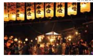
西の盆踊り・ヤートセ