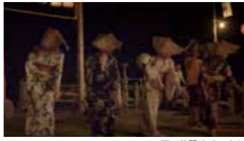
西の盆踊り・ヤートセ