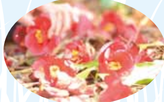
山道に落ちた花も趣があります