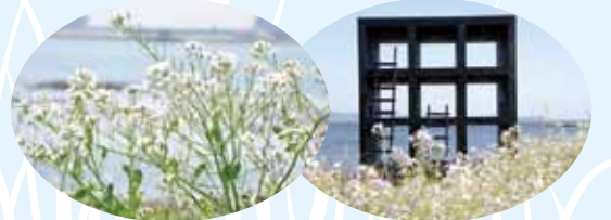
春の佐久島といえばハマダイコンの群生です