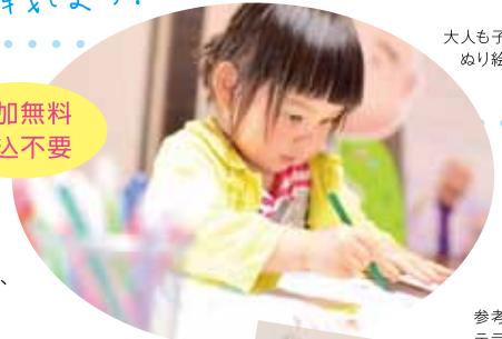
大人も子どももぬり絵に挑戦！

鯉のぼりのぬり絵シートと色鉛筆などの画材が会場に用意してあります。今年はアーティスト・テラオハルミがぬり絵の原画を制作しました。大人も子どもも、どなたでもお気軽にご参加ください。完成したぬり絵は、お持ち帰りいただけます。