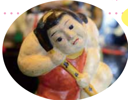
島民から寄贈された節句人形たち

島民から寄贈された昭和初期の端午の節句飾りと、子どもの誕生を祝って贈られた古い土人形を展示します。