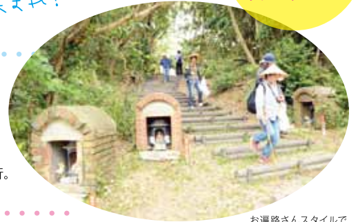
お遍路さんスタイルで歩きますか？

2016年に百周年を迎えた佐久島弘法。島中で弘法祭りのお接待が行われる日に、八十八ヶ所の弘法大師の祠を約3時間半かけてガイド付で歩きます。山道が多いので、歩きやすい靴・服装でお越しください。小雨決行。