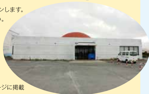
旧海の歴史館外観

【お問合せ先】西尾市役所佐久島振興課 TEL:0563-72-9607(土日祝をのぞく9:00～17:00)