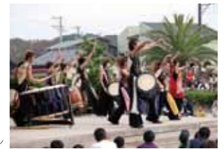
太鼓フェスティバル

10月29日(日) 会場／東地区・大浦海水浴場(東渡船場下船徒歩7分) 佐久島太鼓と愛知県内で活躍する和太鼓演奏グループの競演。会場では島の若者によるマルシェも開催。