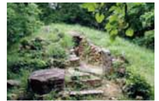
佐久島にはたくさん古墳がある

12月3日(日) 会場／島内各所 島内に残る古墳の周辺整備をするボランティア活動。