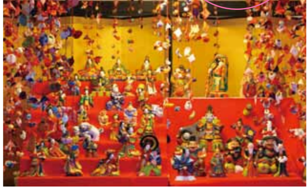
雛まつり展示風景

雛飾りの前には緋毛氈が敷いてあります。お気軽に毛氈の上に座って、期間限定の素敵な記念撮影スポットをお楽しみください。お越しの際は、カメラを忘れずに!