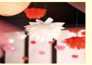
サザンカの飾り付け

昨年12月に開催した「佐久島茶会」では、会場を季節の花である「サザンカ」のイメージで飾り付けました。「佐久島の雛まつり展」に花を添えるため、引き続き展示中。記念撮影にどうぞ。