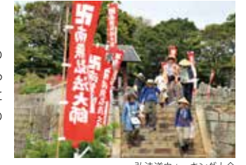
弘法道ウォーキング大会

◎弘法道ウォーキング大会 参加無料・申込不要 4月13日(月) 集合場所／西港渡船場 10:00 佐久島に点在する八十八ヶ所の弘法大師の祠を完全踏破するウォーキングイベント。ガイドによる佐久島弘法やアート作品の解説付。小雨決行。