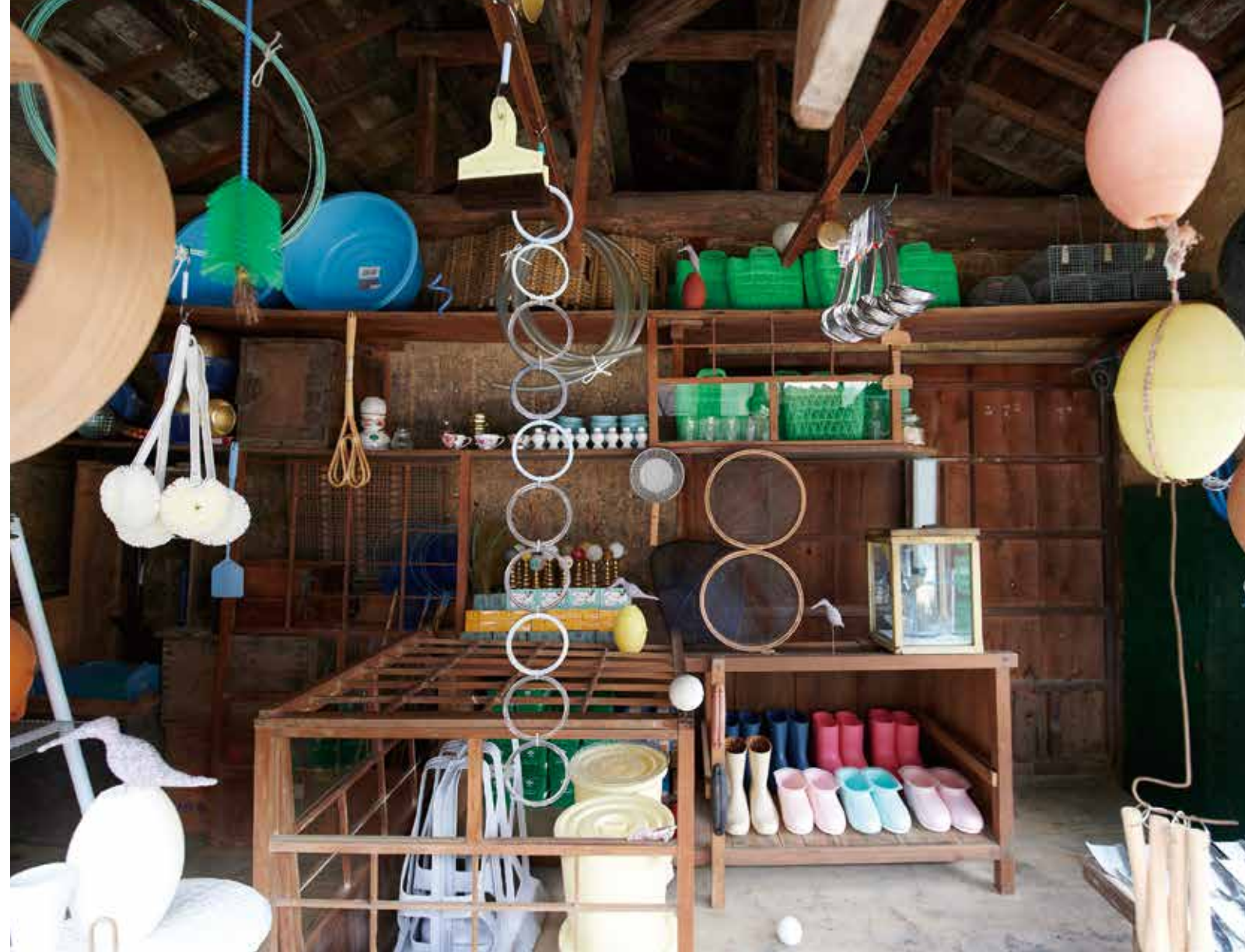
荒木由香里「昼間の星 / いっこく屋」(常設作品)