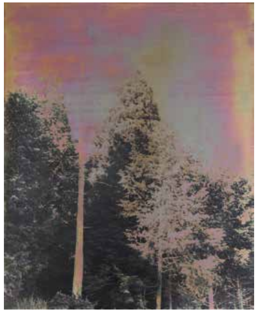
参考作品:「大気」Art emulsion print, 2018

会期／2020年2月22日(土)～5月10日(日) 会場／佐久島・弁天サロングャラリー (西渡船場下船徒歩4分) 開館時間／9:00～17:00 月曜休館 (月曜日が祝日の場合、祝日明けの最初の平日休館)