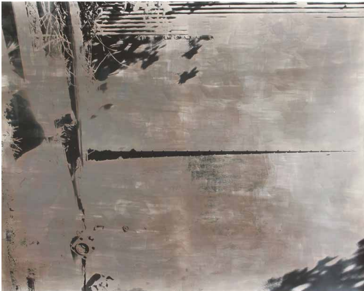
田中翔貴「陸橋 / 大島」Art emulsion print 2019