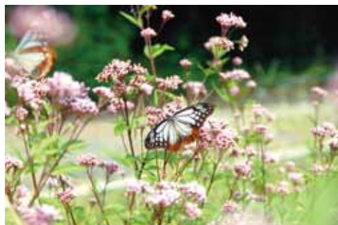
フジバカマの蜜を吸うアサギマダラ