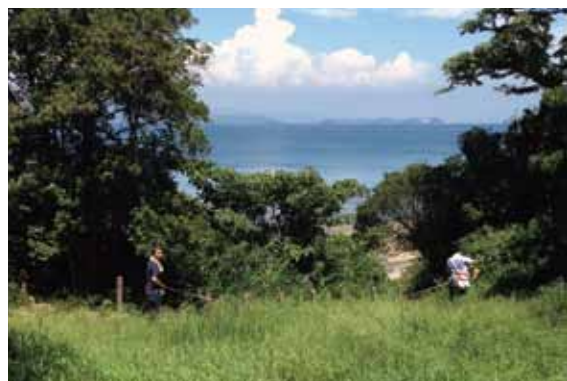
ソテツの広場実測の様子

建築ユニット「Tab」による建築作品が来年2月に新たな佐久島体験を提供します。ハイキングロード沿いにある森に囲まれたソテツの広場にはどのような作品が現れるのでしょうか。建築ワークショップもあるかも? 詳細は次号佐久島からの手紙でお知らせします。ご期待ください!