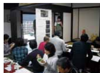
毎年新メニューが登場します