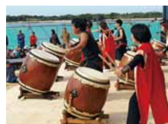
佐久島の秋は祭りとお太鼓の季節

県内の和太鼓演奏グループの共演。もちろん佐久島太鼓も登場。熱い演奏をお楽しみください。