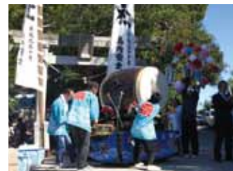
佐久島太鼓の奉納